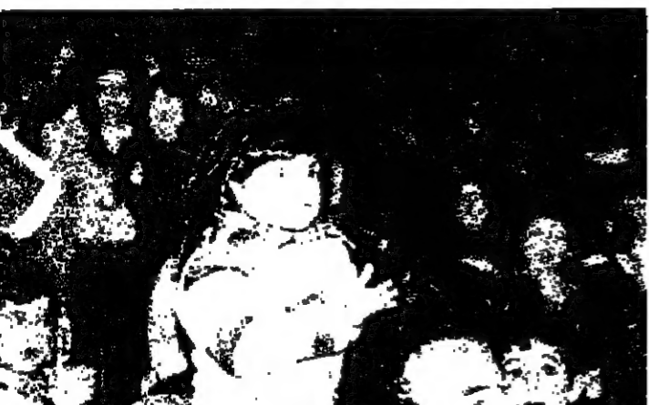
اطفال حضنة سن الليل يحملون الهدايا